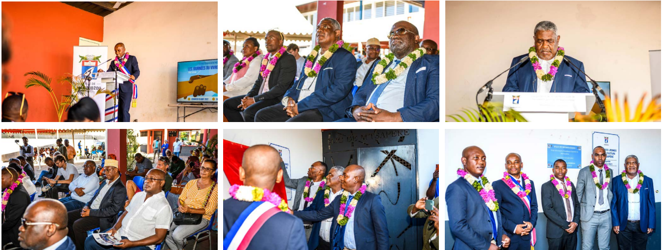
Inauguration du Centre d'excellence sportive par la Ville de Mamoudzou Vendredi 19 août 2022 à M'tsapéré