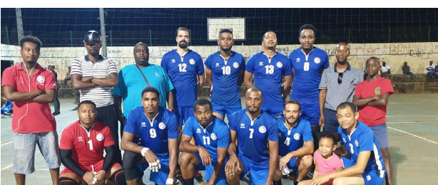
Volley-Ball - Volley Club M'tsapéré, champion de Mayotte et vainqueur de la Coupe de Mayotte masculine