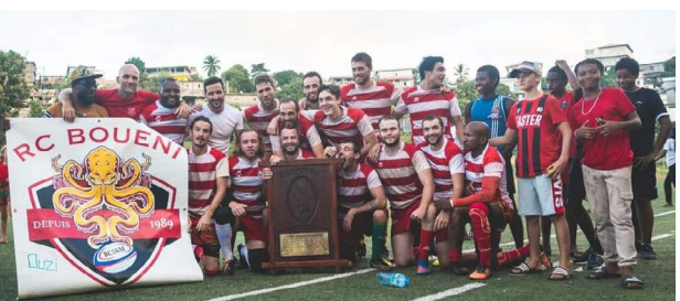
Rugby - Rugby Club du Secteur Sud de Mayotte Bouéni, vainqueur de la Coupe de Mayotte à VII masculine