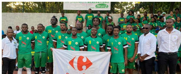
Basket-Ball - Le Vautour Club de Labattoir, champion de Mayotte et vainqueur de la Coupe de Mayotte masculine

Le mois de juin a vu se disputer les ultimes rencontres de basket-ball, de handball, de volley-ball et de rugby, révélant ainsi l'identité des derniers champions et vainqueurs de Coupe de Mayotte de la saison 2021/2022. Honneur à ces équipes qui se sont illustrées pour, finalement, triompher.