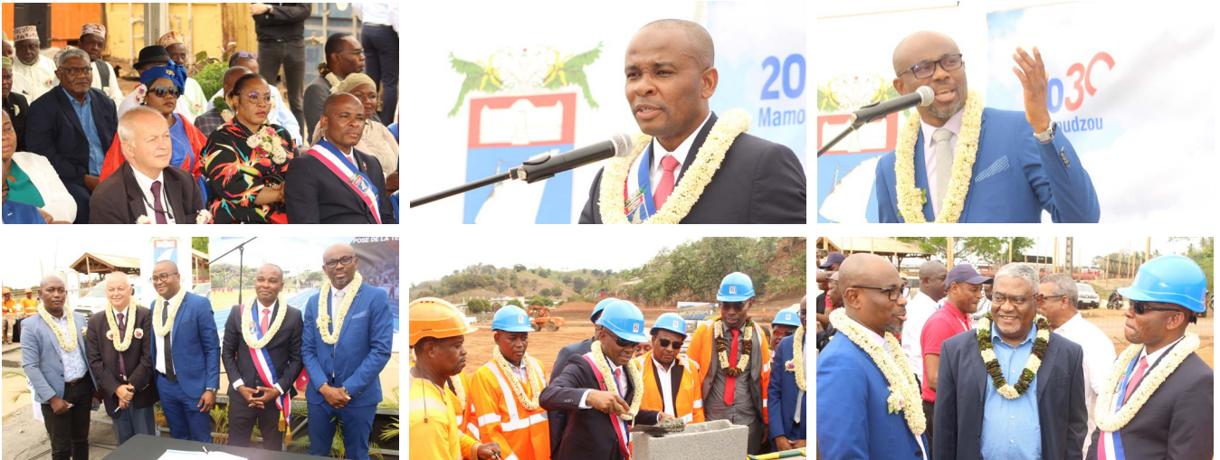
Pose de la première pierre du stade municipal de Tsoundzou Mercredi 31 août 2022 à Tsoundzou 1