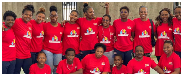
Basket-Ball - Basket Club M'tsapéré, champion de Mayotte féminin