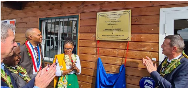
Inauguration de la Maison France Service de Sada, en mars dernier.

Une grande partie des associations sportives mahoraises possède le statut d'association bénévole. Afin de pérenniser leur développement, le Comité Régional Olympique et Sportif peut compter sur le CRIB, qui permet aux dirigeants d'associations et aux bénévoles d'être accompagnés lors des démarches administratives. Nécessitant beaucoup de temps et de concentration, ces dernières sont également facilitées par l'apparition sur le territoire des maisons France Services, qui travaillent en collaboration avec le CRIB.