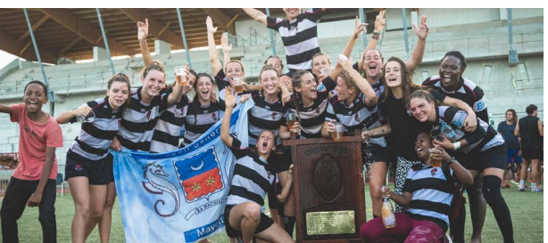
Rugby - ASA Chiconi, vainqueur de la Coupe de Mayotte à VII féminine