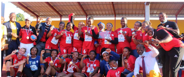
Handball - ASC Tsingoni, champion de Mayotte et vainqueur de la Coupe de Mayotte féminine