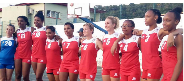
Volley-Ball - Volley Club M'tsapéré, vainqueur de la Coupe de Mayotte féminine