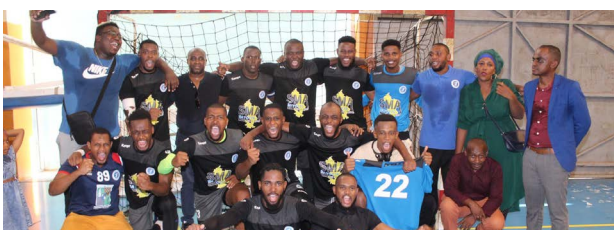
Handball - Combani Handball Club, champion de Mayotte et vainqueur de la Coupe de Mayotte masculine