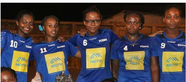
Volley-Ball - Volley Club Kani-Bé, champion de Mayotte féminin